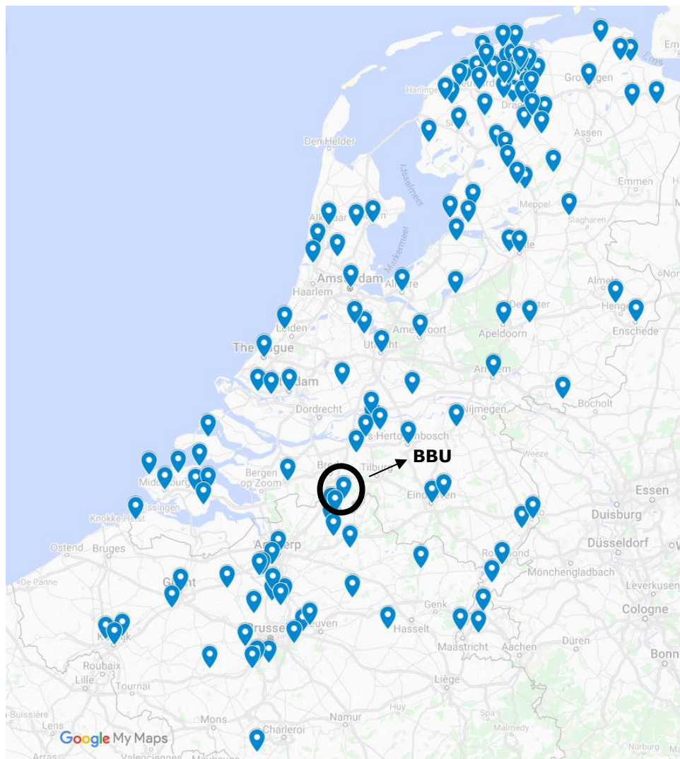
Figuur 1: Alle brassbands in Nederland en België